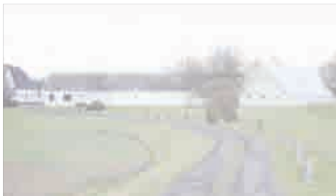
Bosætning på landet 🏡