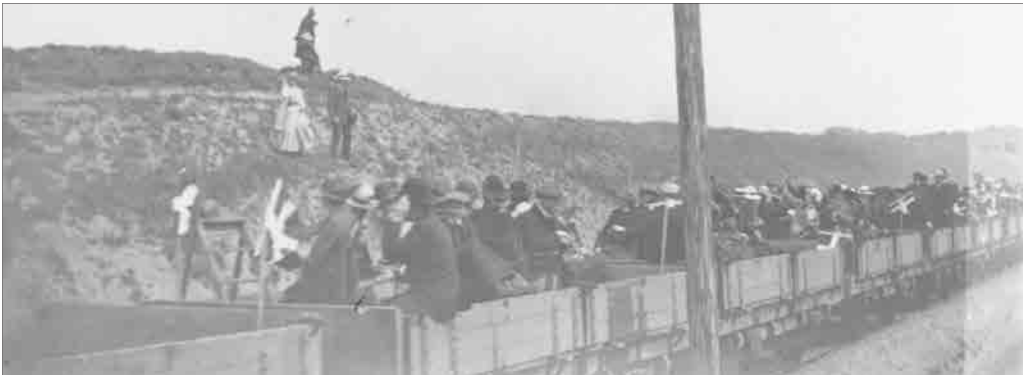
Den første prøvetur til Lønstrup med passagerer i 1913

Den oprindelige del af Hirtshalsbanen er udpeget som kulturmiljø med henblik på, at historien om privatbanerne i denne del af Vendsyssel fortælles.