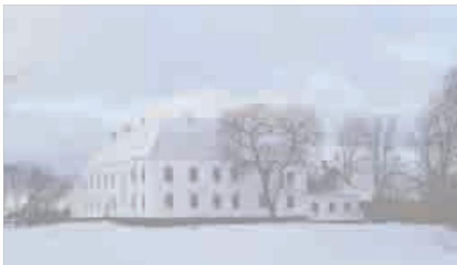
Klostre og hovedgårde 🏰