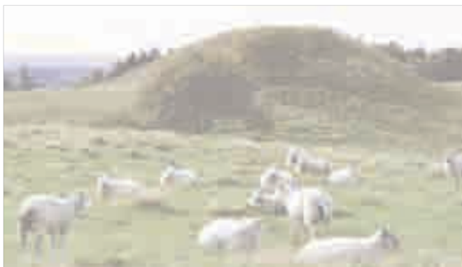
Markante fortidsminder 🏞️