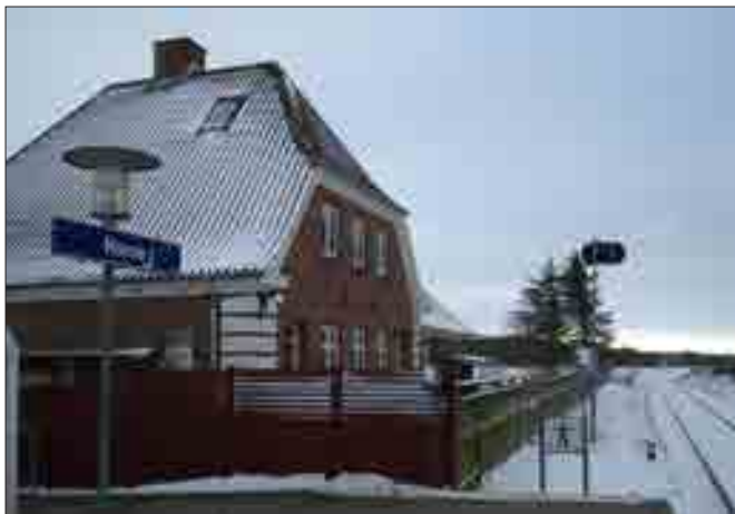
Typisk stationsbygning ved Horne Station

Stationsbygningerne i Vellingshøj, Vidstrup, Tornby og Horne anvendes til private boliger. Der er fortsat pakhuse tilbage i Vidstrup og Tornby. Både stationsbygninger og pakhuse er generelt bevaret med deres oprindelige udseende og karakter. Pakhusene anvendes til opbeva-