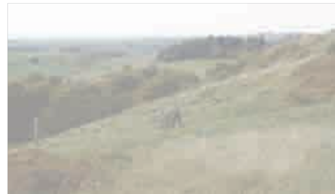
Rekreative anlæg 🌳